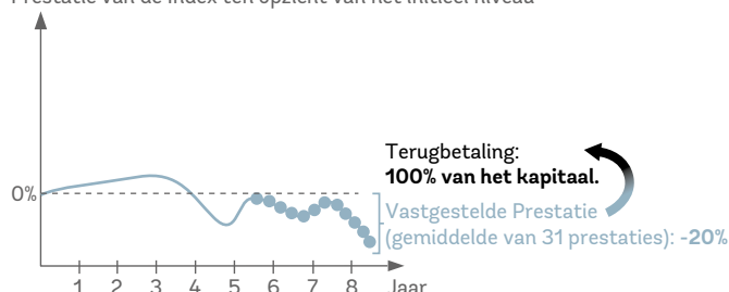
Prestatie van de Index ten opzichte van het initieel niveau